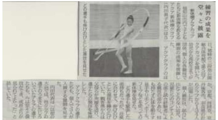
10月7日(火)の両丹新聞に掲載されました。