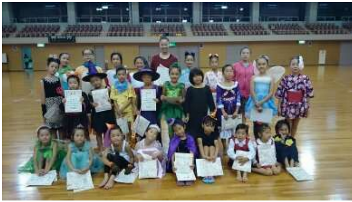
年々ハロウィンの衣装も工夫され、面白かったです(^ ^)

ただき、ありがとうございました。次は発表会に向けて頑張っていきます。また、応援よろしくお願い致します。